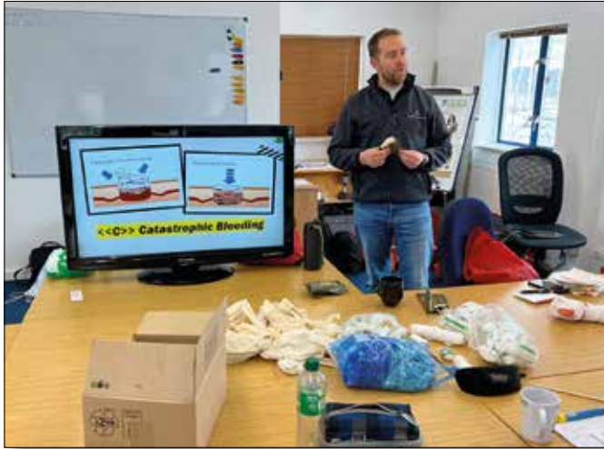
Ein Tag First Aid in englischer Sprache. Unser Trainer legt dabei Wert auf eine Besprechung der Maßnahmen, wie sie praxistgerecht an Bord einer Yacht durchgeführt werden können

MAXIMAL 4 TEILNEHMER • VORBEREITUNG UND PRÜFUNG