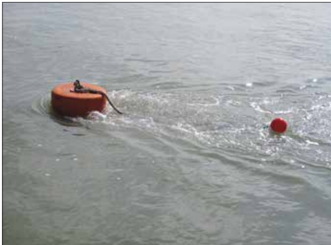
Mooringbojen im Strom unter Motor und Segel aufnehmen