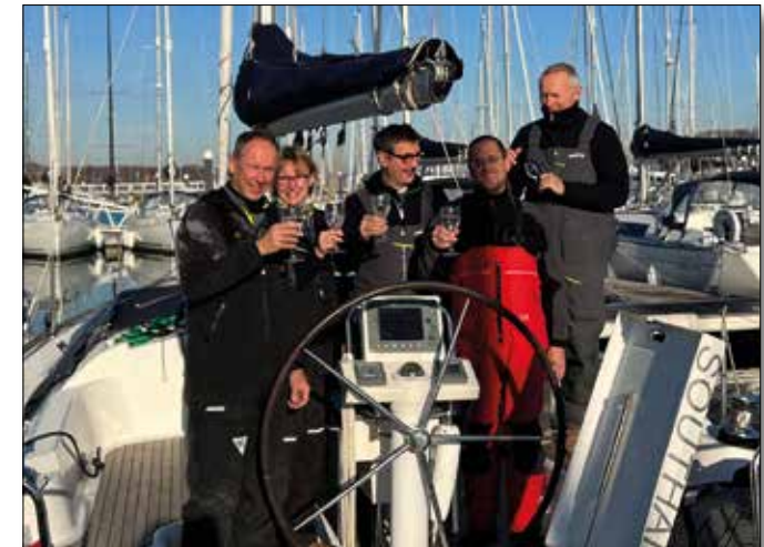
Ein Gläschen zur bestandenen Prüfung darf natürlich nicht fehlen!