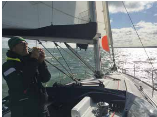
Ansteuerungsübung mit Handpeilkompass