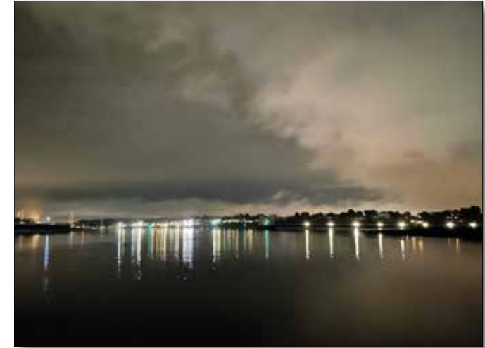
Kaum zu glauben, aber hier verbirgt sich ein Navigationslicht!