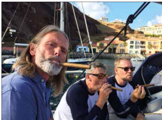
Wohl verdient: Zigarre nach bestandener Yachtmaster Ocean-Prüfung