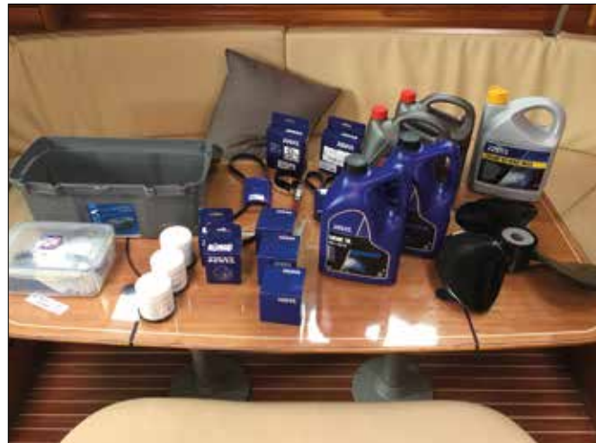
Beispiel Thema für eine YM Ocean Prüfung - Welche Teile und Werkzeuge benötige ich für den Motor an Bord?