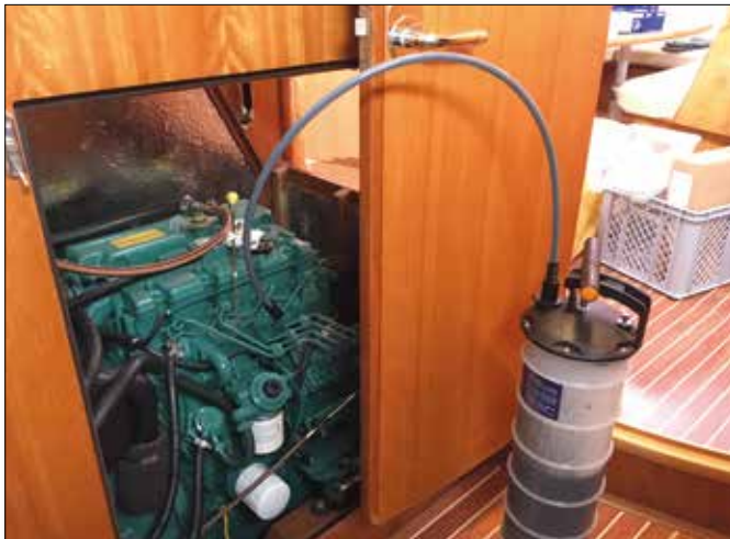
Motorservice an Bord - Welche Ersatzteile und Werkzeuge werden für den „Service unterwegs“ benötigt?