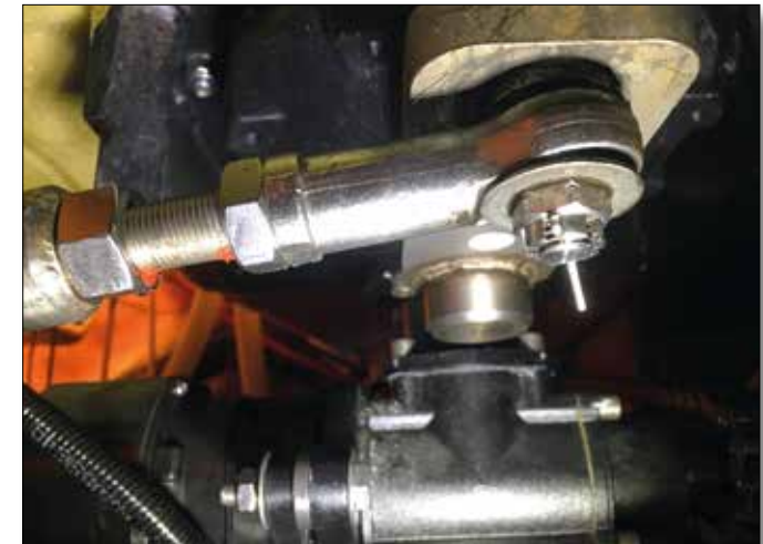
Technik-Check an Bord - Ist die Steuerungs-Mechanik o.k.?