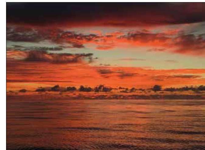
„Lichtspiele“, wie man sie nur auf See erlebt!