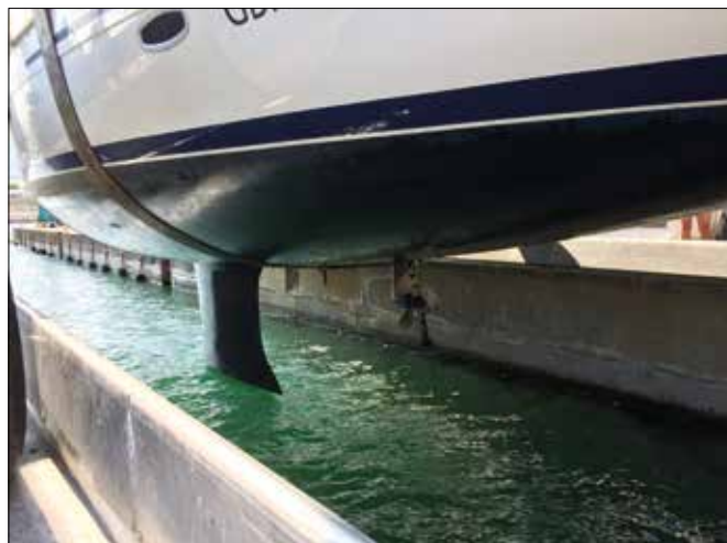
Hochseepassagen stellen zahlreiche Herausforderungen an Yacht & Crew: Außerplanmäßiger Lift auf den Azoren wegen einer Fischerleine im Propeller