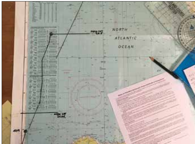
Dokumentation für eine YM Ocean Prüfung - Seekarte & Logbook