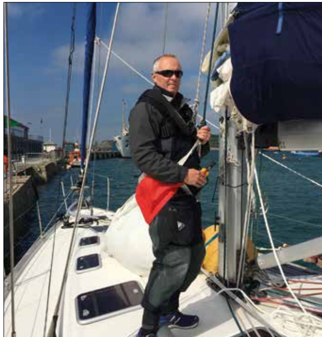
Rigg Check - vor jeder Passage wird das Rigg auf Schäden überprüft