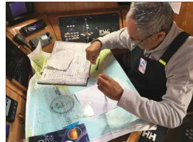
Verwendung der Astrostandorte in der aktuellen Navigation an Bord - die Hochseepassagen werden ohne GPS Daten navigiert