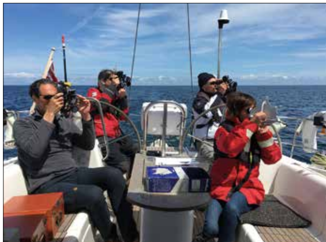
Gleichzeitige Mittagsbreiten-Messung mit verschieden Sextanten

HOCHSEEPASSAGEN MIT ASTRONAVIGATION GEMÄSS RYA YM OCEAN PRÜFUNGS AUFLAGEN