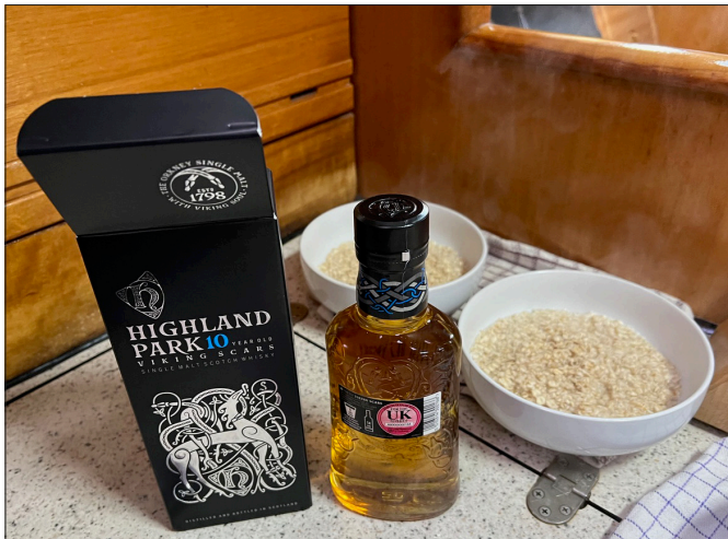
Schottisches Frühstück - Porridge mit einem Teelöffel Whisky...