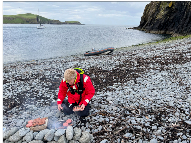
Ankerstopp mit Beach Barbecue auf den Hebriden